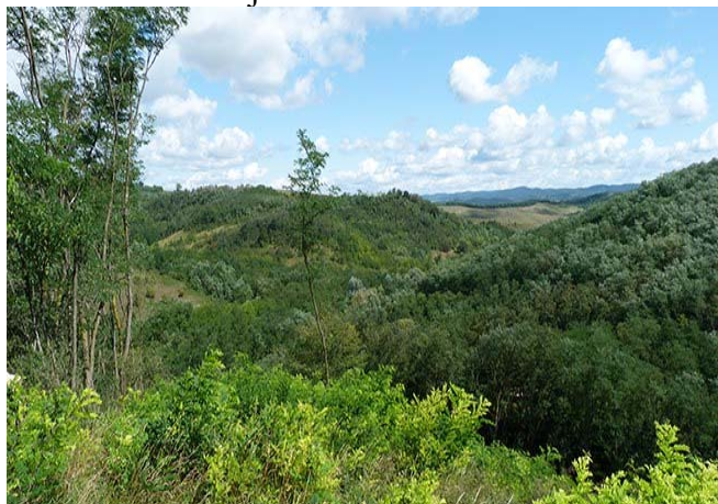
Kilátás a Kisfüzesi várból