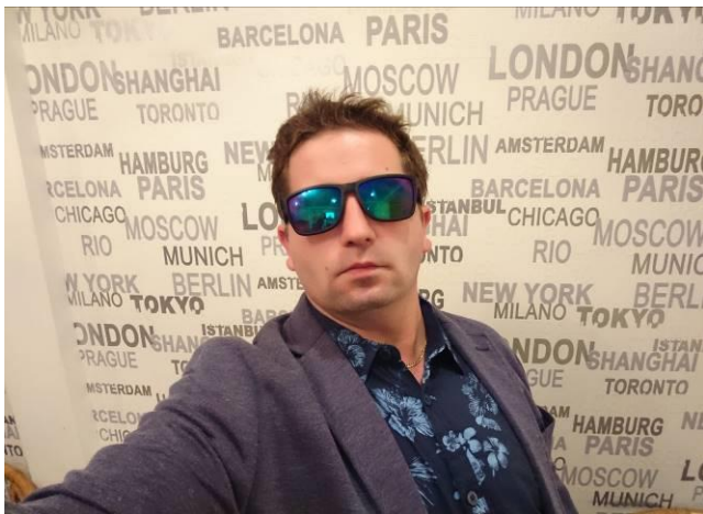
Menyhárt Balázs polgármester

Hosszabb idő elteltével ebben az évben még csak az első, de remélhetően nem az utolsó Kiszüzesi Hírlevelet tarthatjuk a kezünkben. Az ideai Hírelvél késői megjelenésének okát gondolom senkinek sem kell bemutatnom (komoly bejelentés reményében), de annál nagyobb öröm számomra, hogy végre a nagyobb települési fejlesztések is elkezdődtek immár több mint egy hónapja.